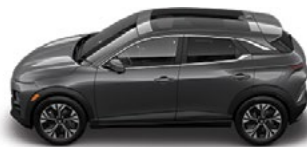
GRAFITNO siva Kovinska