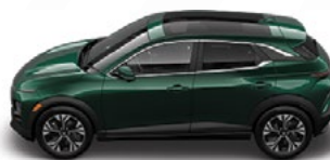
SMARAGDNO zelena Kovinska