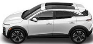
BISERNO bela Enoslajna

BISERNO bela barva je vključena v osnovno ceno vozila. Vse ostale barve so na voljo z doplačilom 500 € (z DDV).