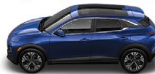
KRALJEVO modra Kovinska