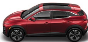
IMPERIAL rdeča Kovinska